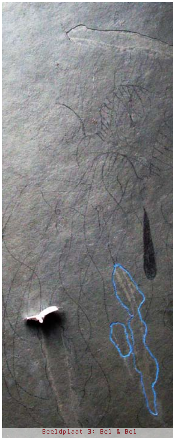
Beeldplaat 3: Bel & Bel

Koeten in koor: 'Meeuw/mus/duif/ekster/raaf/koet/reiger! Meeuw/mus/duif/ekster/raaf/koet/reiger!'