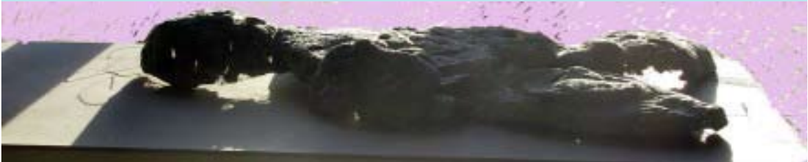
Breadman Twee: een schimmelziel in het zonnetje

Mijn onderzoekswens (een totale vernietiging van de broodpop uitlokken in een dag) is veranderd. Doordat de broodpoppen gaan schimmelen, leven zij voort, geschonden en wel, als bewijsstukken van de aanval door de vogels. Breadman blijft manshoog of beter gezegd mansplat (bescheiden formaat anders is hij onvervoerbaar) en daarmee uit.